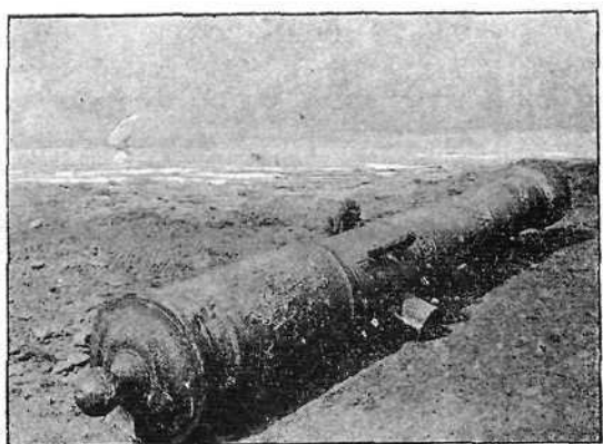
Cañón Tigre , uno de cuyos disparos se supone que hirió á Nelson.